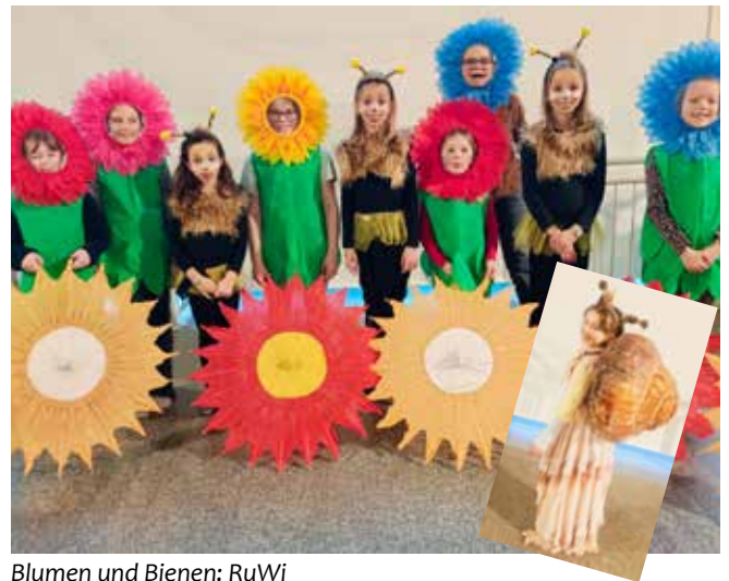
Blumen und Bienen; RuWi

Weitere Informationen, Fotos, Termine und Ticketinfos gibt es demnächst auf unserer Facebookseite sowie auf der Homepage www.regionumwolkersdorf.at