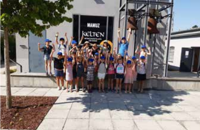
„Busfahrt ins Mamuz“ – Gemeinde Ulrichskirchen-Schleinbach-Kronberg am 13. August