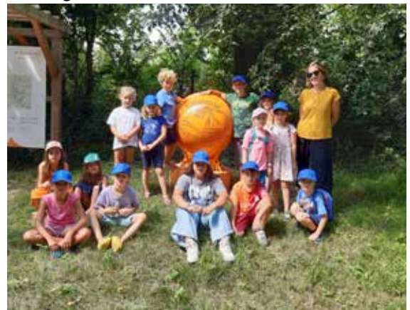
„Fit & Fun“ – USC Kronberg am 1. August