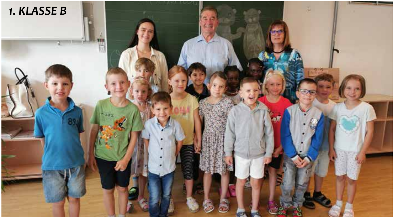
1. KLASSE B