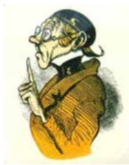
Lehrer Lämpel aus „Max und Moritz“, W. Busch